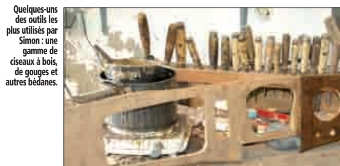
Quelques-uns des outils les plus utilisés par Simon : une gamme de ciseaux à bois, de gouges et autres bédanes.